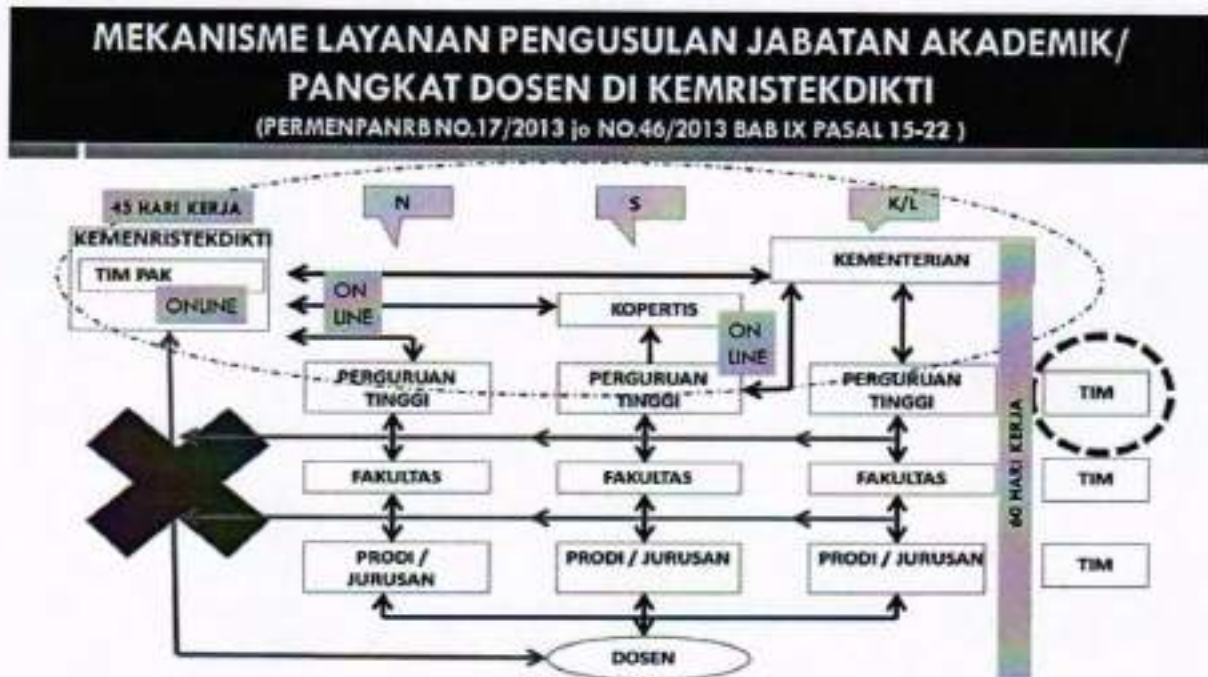
Gambar 1. Mekanisme Layanan Pengusulan Jabatan Akademik/Pangkat Dosen

Kenaikan jabatan akademik/pangkat dosen merupakan bagian tidak terpisahkan dengan pengembangan karir dosen, dengan demikian mekanisme penilaian dan proses kenaikan jabatan akademik/pangkat dosen akan diintegrasikan secara online (daring). Dengan sistem daring diharapkan dapat meningkatkan efisiensi layanan dan mendukung prinsip-prinsip penilaian, sebagaimana pada Gambar 1.